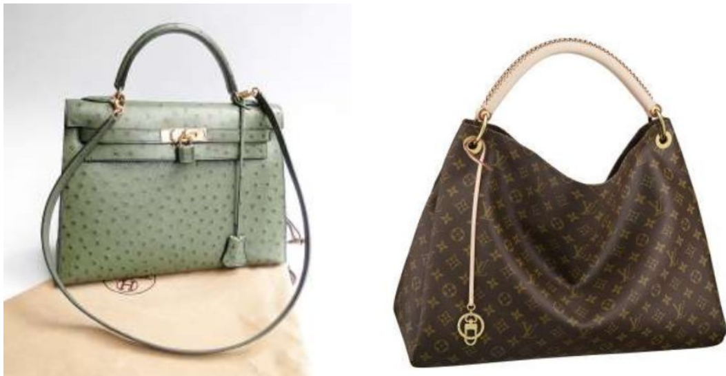
(左) HERMES—Kelly Bag；(右) Louis Vuitton 的手提包 Hermes 顯得較貴氣較精緻，LV 給人的感覺較實用較休閒。

相對地，Louis Vuitton 走向大眾奢侈品的路線，雖然近期打算走向更高級奢侈品的路線，可是功力還是遠不及Hermes，總結來說 Louis Vuitton 就像是件工藝品，而 Hermes 就像是件藝術品。而另外有些意大利皮件精緻的皮革手工小品牌，雖也是精細，但是也無法和 Hermes 來相提並論，畢竟這種種的技術和原料是必須有著龐大資金通路的支撐和時間技術的累積才有的成果。