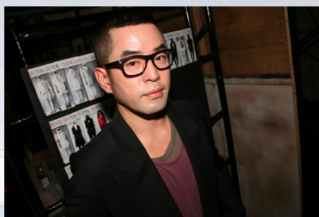
(圖一 Juunj designer)

她喜歡較為中性的風格，不喜歡太女性化、柔弱的感覺，而這兩位設計師的設計就是偏向中性的風格。