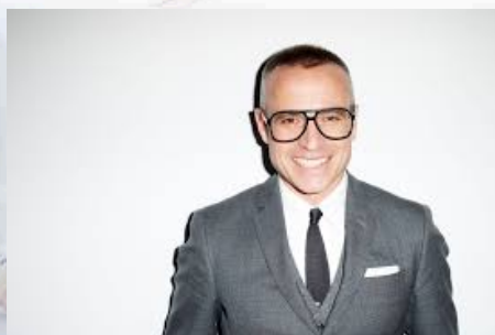
(圖二 Thom Browne designer )